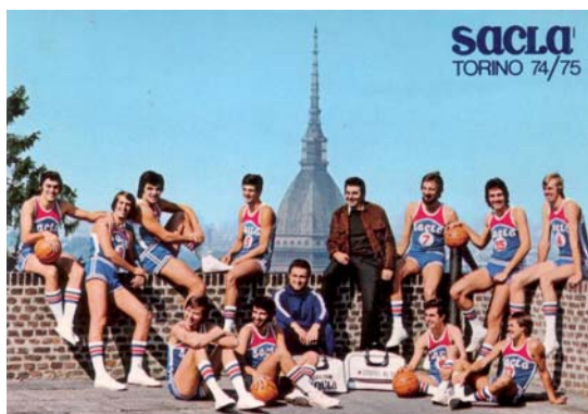
Saclà 1974/1975 - Serie A